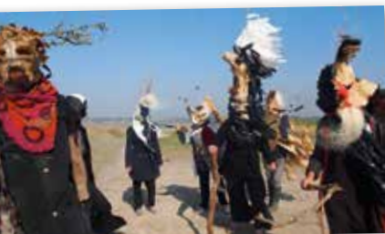
Atelier masques

Gratuit, ouvert à tous (plus d'info au dos du programme)