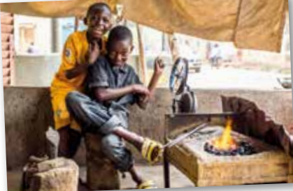
Visages de Bamako © Swan

Gratuit, sur inscription au Tél. 02 96 31 61 80